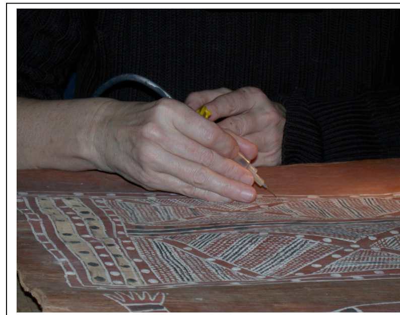
Refixage en cours