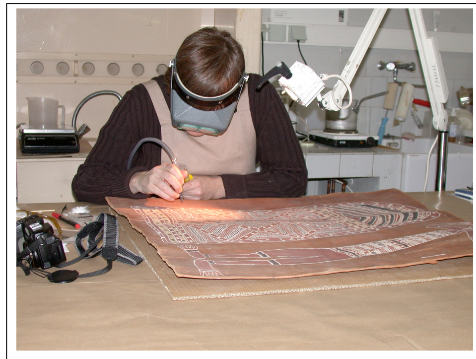
En cours d'intervention

Lot 10 – ensemble de 19 écorces peintes Groupement : Vincent, Bergeaud, Perrin et Sindaco