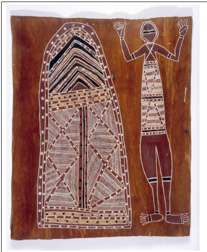
Vue générale, © Anne Chauvet, C2RMF

Lot 10 – ensemble de 19 écorces peintes Groupement : Vincent, Bergeaud, Perrin et Sindaco