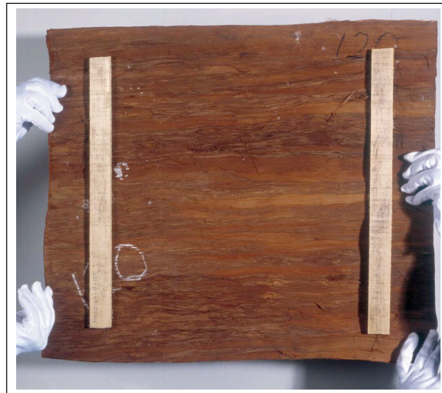
Tasseaux au dos avant intervention, © Anne Chauvet, C2RMF