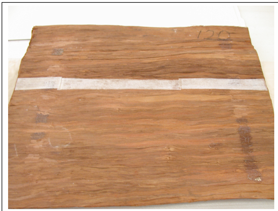
Doublage au dos de l'écorce, le long de la fente