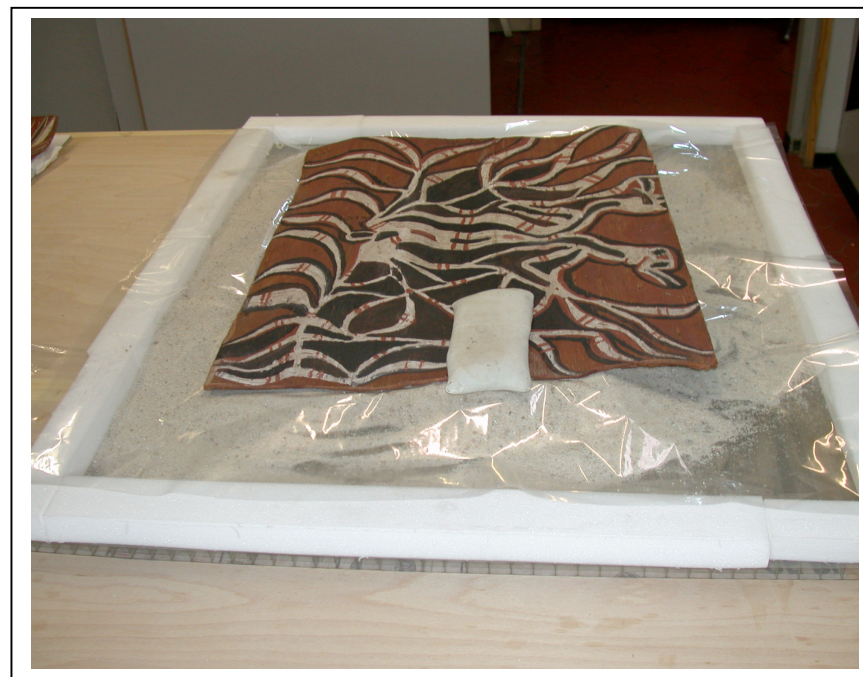
Séchage sous poids