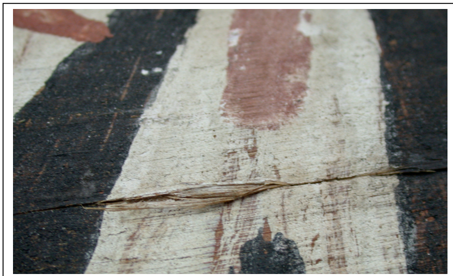
Avant remise dans le plan des fibres