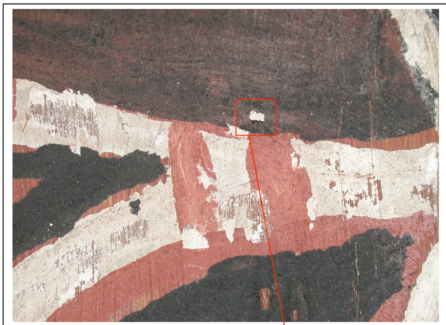
Zone avec couche picturale lacunaire