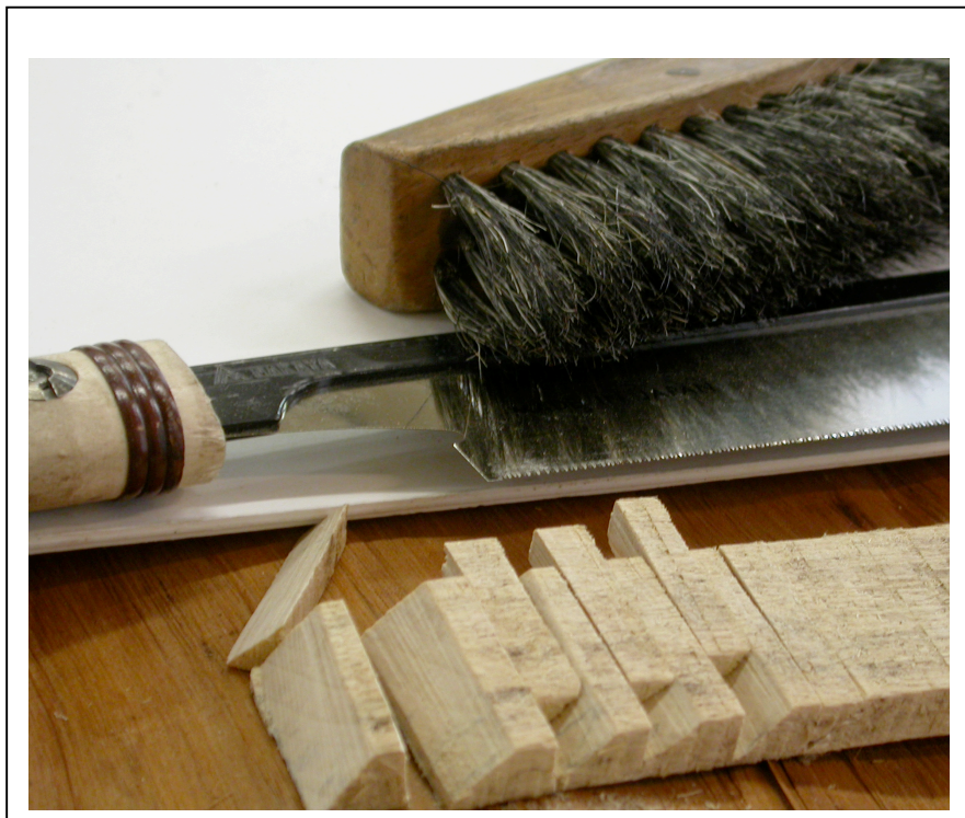
Retrait des tasseaux au dos