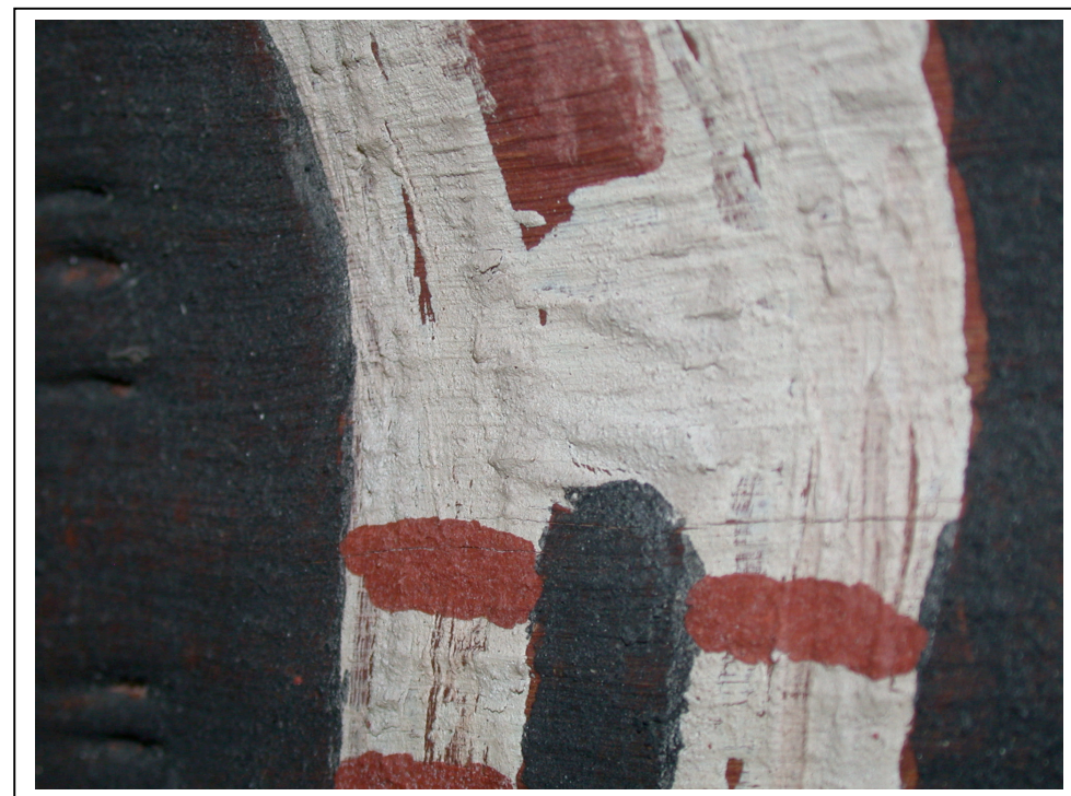
Soulèvements de la couche picturale