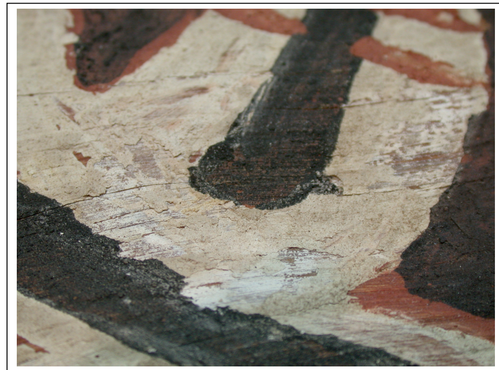
Après intervention et refixage des soulèvements