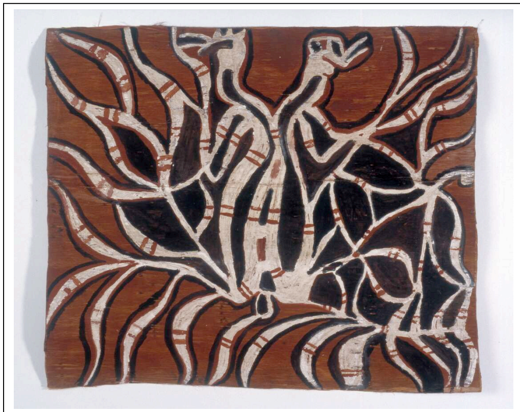
Vue générale