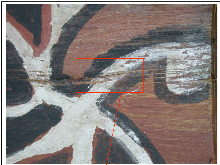
Fente ouverte avant remise dans le plan des fibres