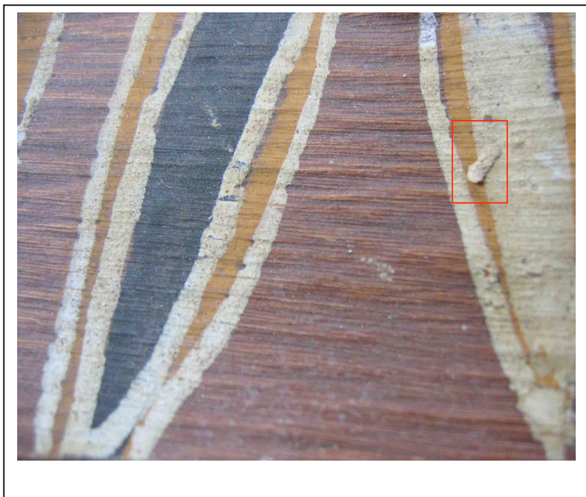
Écaille déplacée avant refixage