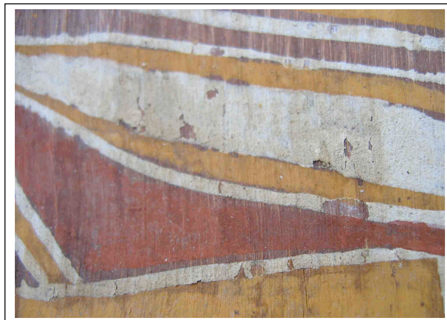
Lacunes et soulèvements