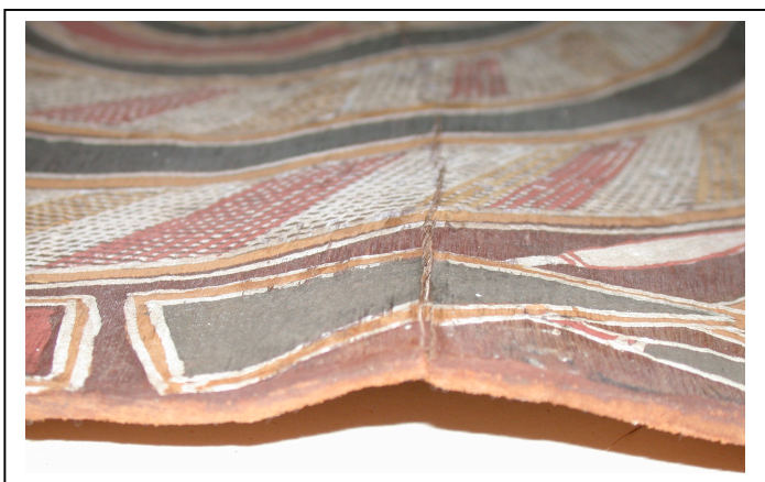
Après remise dans le plan

Lot 10 - Ensemble de 10 ceases peintes Groupement : Vincent, Bergeaud, Perrin et Sindaco