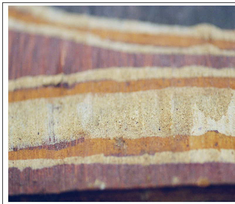
Taches jaune-brun dans la partie supérieure