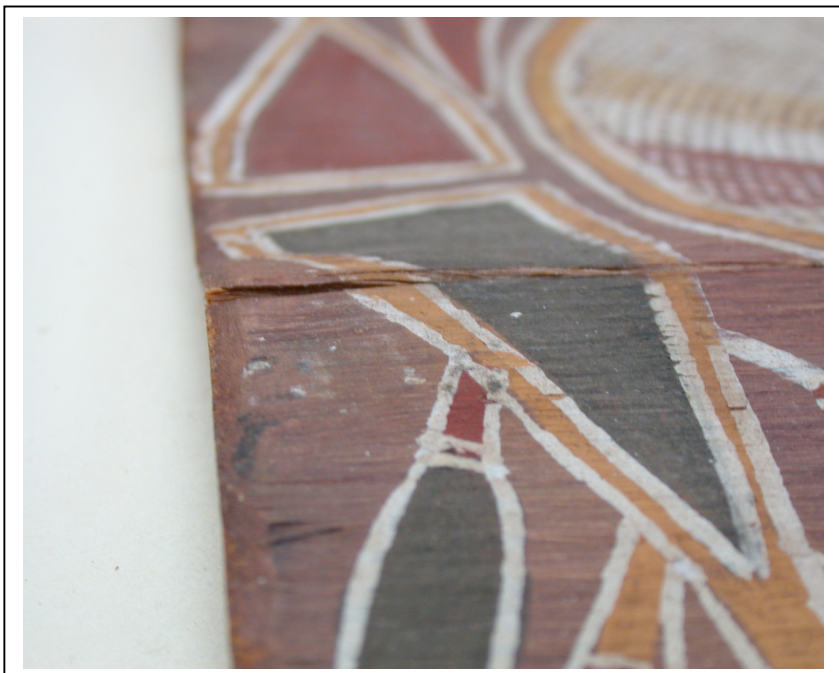
Fente ouverte avant doublage