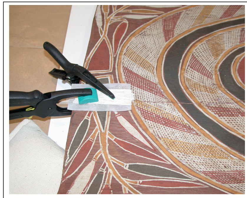
Mise sous presse le temps du séchage