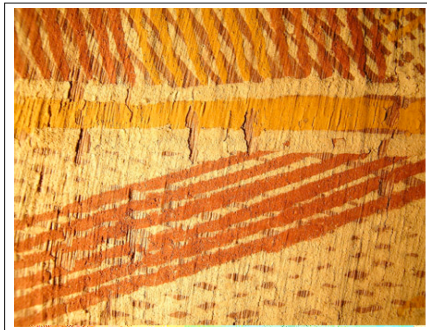
Soulevements de la couche picturale