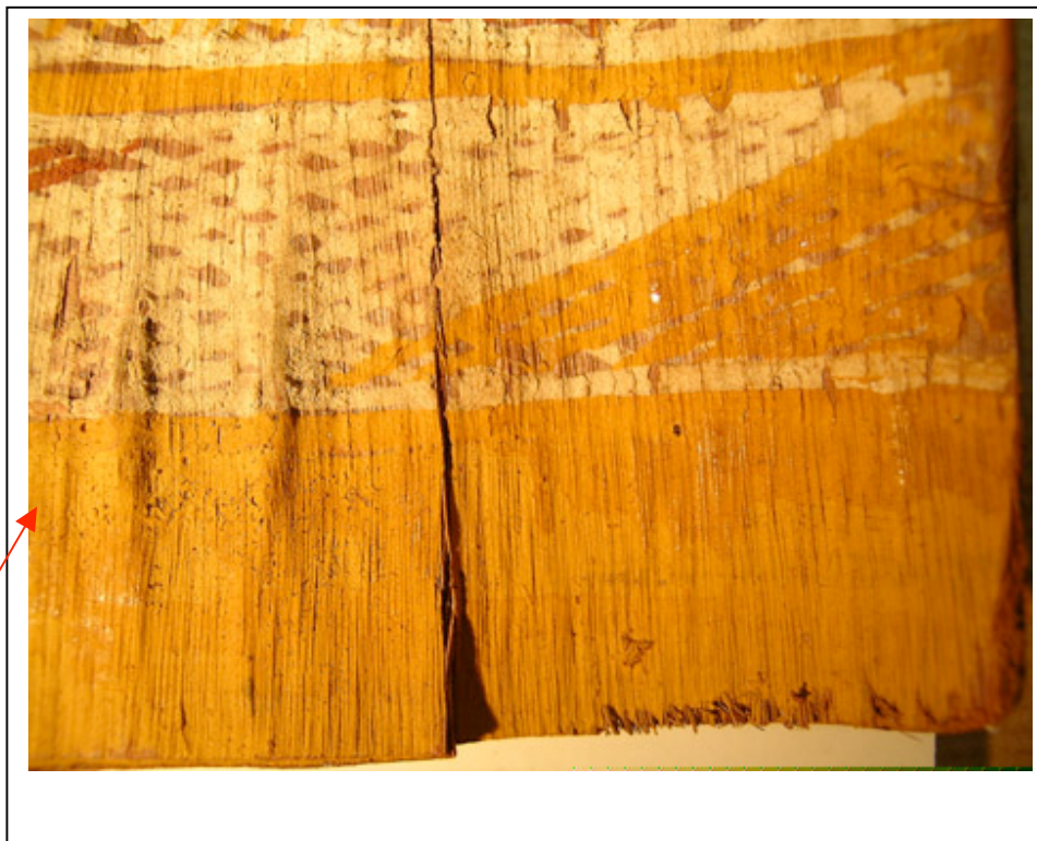
Vue générale

Lot 10 – ensemble de 19 écorces peintes Groupement : Vincent, Bergeaud, Perrin et Sindaco