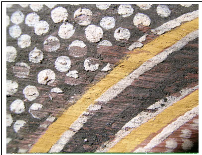
Déplacement des points blancs