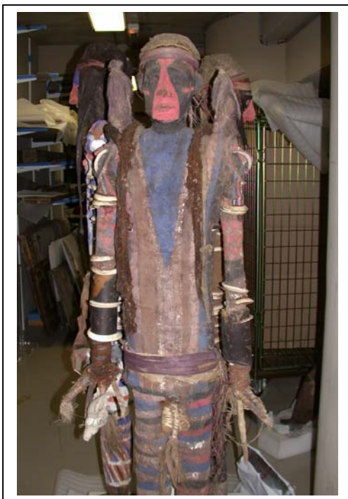
Détails de l'œuvre