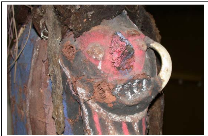
Dent de cochon manquante