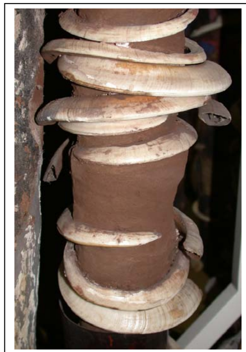
Enduit coloré différent