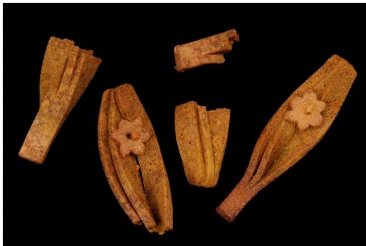
Illustration 4. Gâteaux , 7,2 x 4,2 x 1,7cm, pâte de riz, Japon, musée du quai Branly – Jacques Chirac, numéro d'inventaire 71.1939.97.274.1-3.