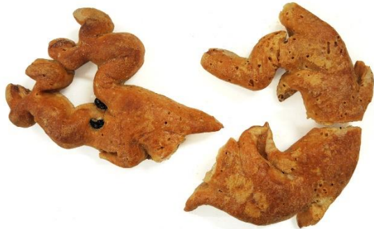
Illustration 7. Pain , 19 x 14 x 2 cm, Thaïlande, musée du quai Branly – Jacques Chirac, numéro d'inventaire 71.1978.23.121.