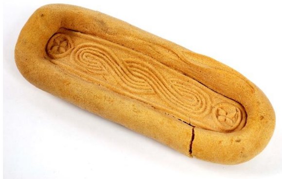
Illustration 8. Pain , 25,5 x 9,5 x 4cm, Mongolie, musée du quai Branly – Jacques Chirac, numéro d'inventaire 71.1981.25.38.