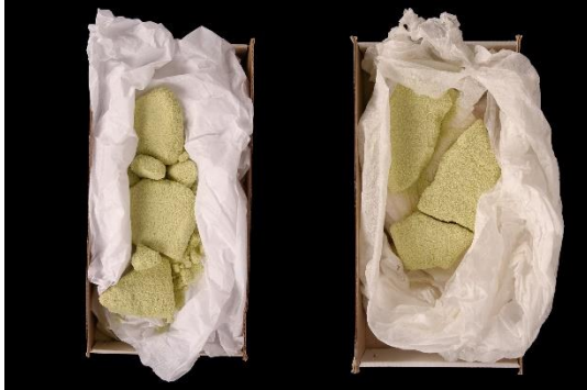
Illustration 3. Gâteaux « Okashi » , 26 x 14 x 14cm, gâteau, papier, carton, Japon, musée du quai Branly – Jacques Chirac, numéro d'inventaire 71.1939.97.217.1-2.