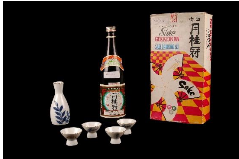
Illustration 1. Boîte contenant une bouteille de sake et un service a sake , 8,5 x 33 x 17cm, carton, porcelaine, verre, saké, papier, Japon, musée du quai Branly – Jacques Chirac, numéro d'inventaire 71.1988.63.1.