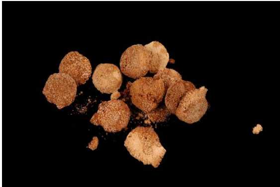
Illustration 5. Gâteaux , 3,1 x 5,3 x 5,3cm, farine, sucre, Japon, musée du quai Branly – Jacques Chirac, numéro d'inventaire 71.1939.97.263.1-4.