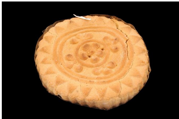
Illustration 9. Pain , 14 x 13 x 2cm, Mongolie, musée du quai Branly – Jacques Chirac, numéro d'inventaire 71.1981.25.39.